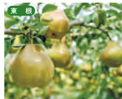
東根 ラ・フランス [10月下旬~11月]