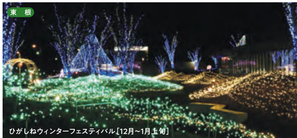
東根 ひがしねウィンターフェスティバル [12月~1月上旬]