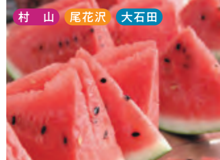
村山 尾花沢 大石田 スイカ [7月下旬~8月]