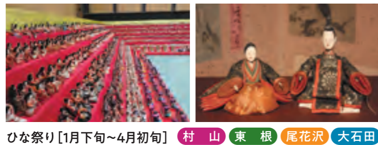
ひな祭り [1月下旬~4月初旬] 村山 東根 尾花沢 大石田