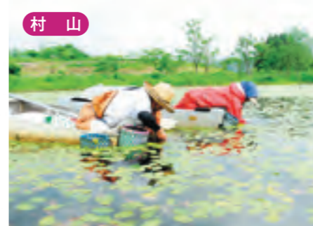
村山 天然ジュンサイ摘み採り体験 [6月上旬~7月下旬]