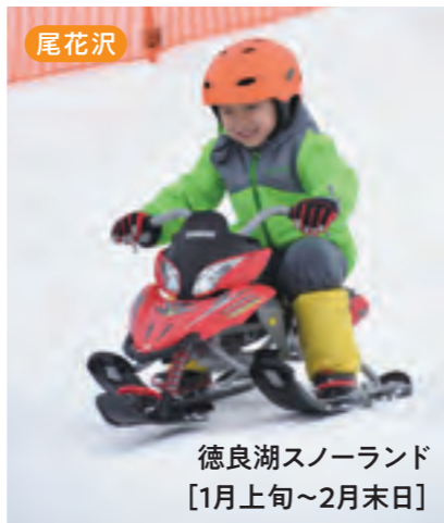
尾花沢 徳良湖スノーランド [1月上旬~2月末日]