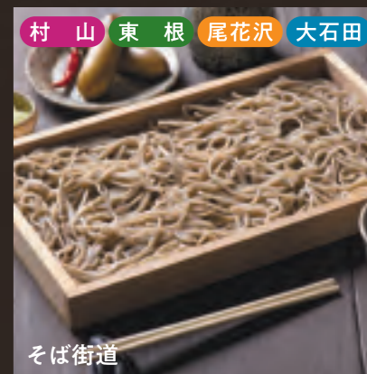
村山 東根 尾花沢 大石田 そば街道