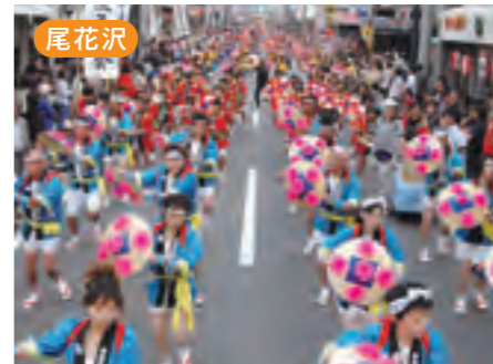
尾花沢 おばなざわ花笠まつり [8月27・28日]