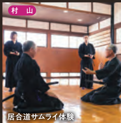
村山 居合道サムライ体験