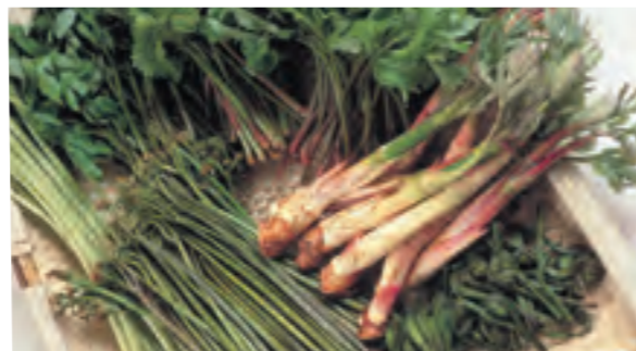
次年子山菜まつり [6月中旬] 大石田