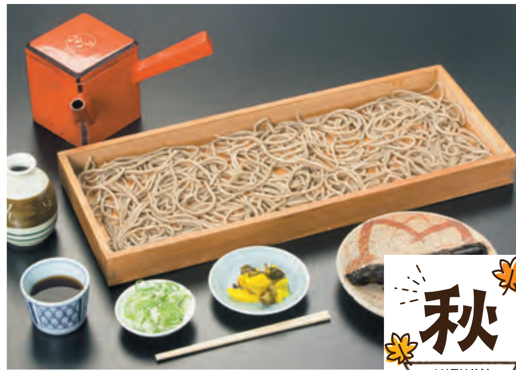
新そば [10月中旬~11月] 村山 東根 尾花沢 大石田