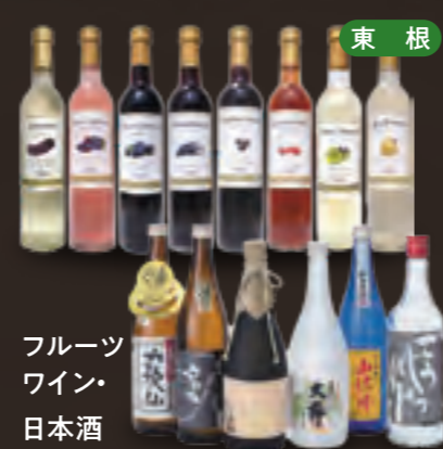
東根 フルーツワイン・日本酒