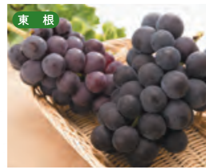
東根 ぶどう [9月上旬~10月上旬]