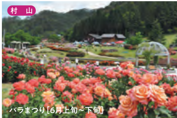
村山 バラまつり [6月上旬~下旬]