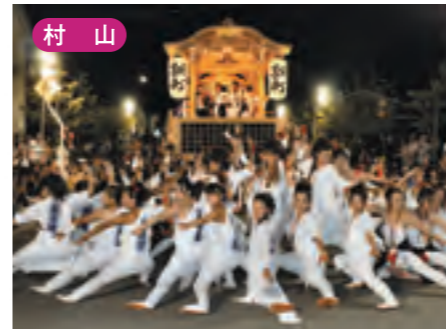
村山 むらやま徳内まつり [8月下旬]