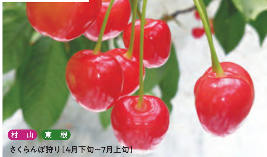
村山 東根 さくらんぼ狩り [4月下旬~7月上旬]