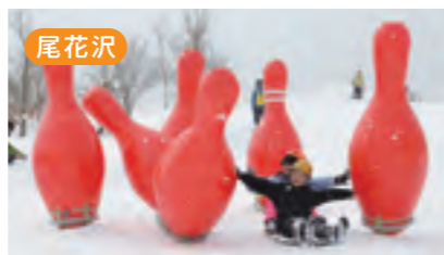
尾花沢 尾花沢雪まつり [2月下旬]