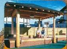
湯量豊富な さくらんぼ東根温泉