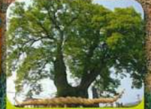
国指定特別天然記念物 東根の大ケヤキ