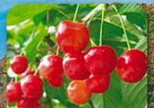
さくらんぼ生産量日本一 佐藤錦発祥の地 果樹王国ひがしね