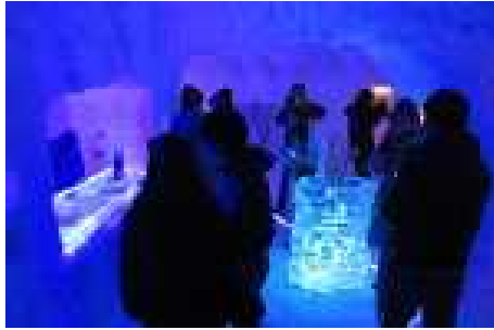
会場内にはアイスパーも!!

※発着時の駐車場は、さくらんぼ東根温泉宿泊旅館もしくは、さくらんぼ東根温泉足湯駐車場、JRさくらんぼ東根駅駐車場をご利用下さい。